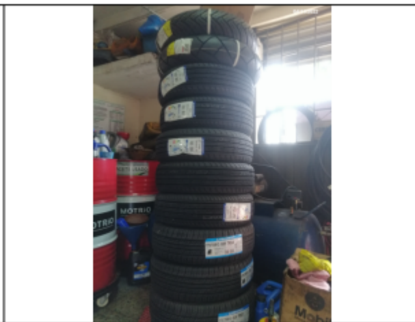
Foto 2. Vista general del acopio de llantas.