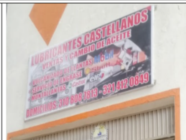
Foto 4. Vista general de la Publicidad Exterior Visual.