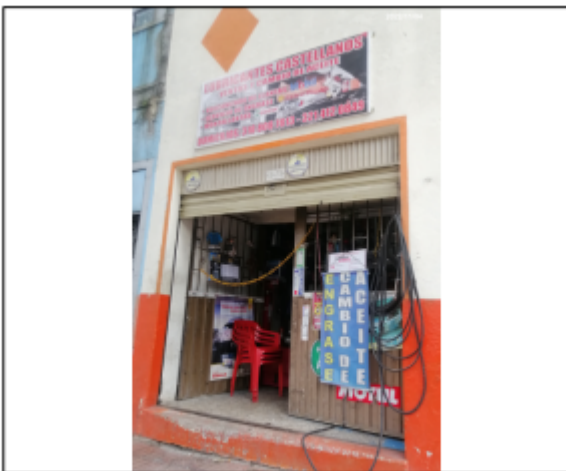
Foto 1. Vista general del establecimiento.