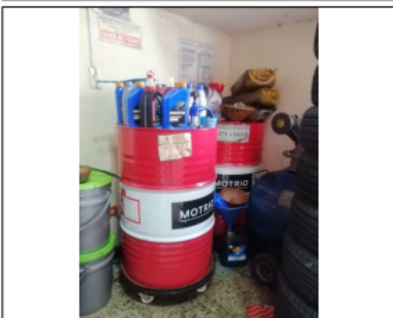
Foto 3. Vista general del acopio de aceites